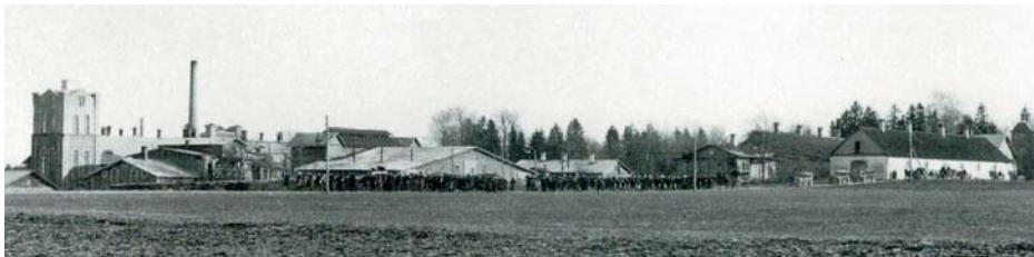
Arved Kurbergi matuserongkäik.