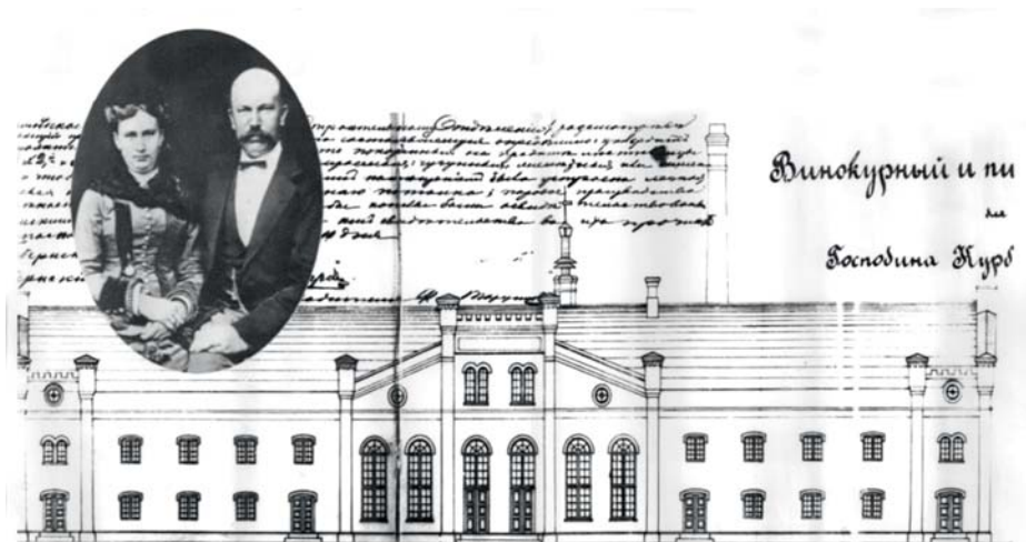
Vabriku projekt aastast 1886.