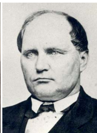
Johann Voldemar Jannsen (1819–1890)

L 869 oli Eestimaa jagatud Liivimaa ja Eestimaa kubermangude vahel. Sealjuures oli Lõuna-Eestit katva Liivimaa keskuseks Riia, mis oli oluliselt suurem ja edumeelsem linn, kui Eestimaa keskuseks olev Tallinn, tollal Reval. Kõiki ühiskondlikke protsesse vedas ikkagi Liivimaa ja paariaastase viivitusega viidi reformid läbi ka Eestimaal.