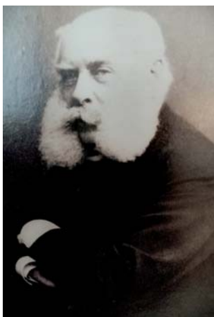
Alexander von Oettingen (1827–1905)